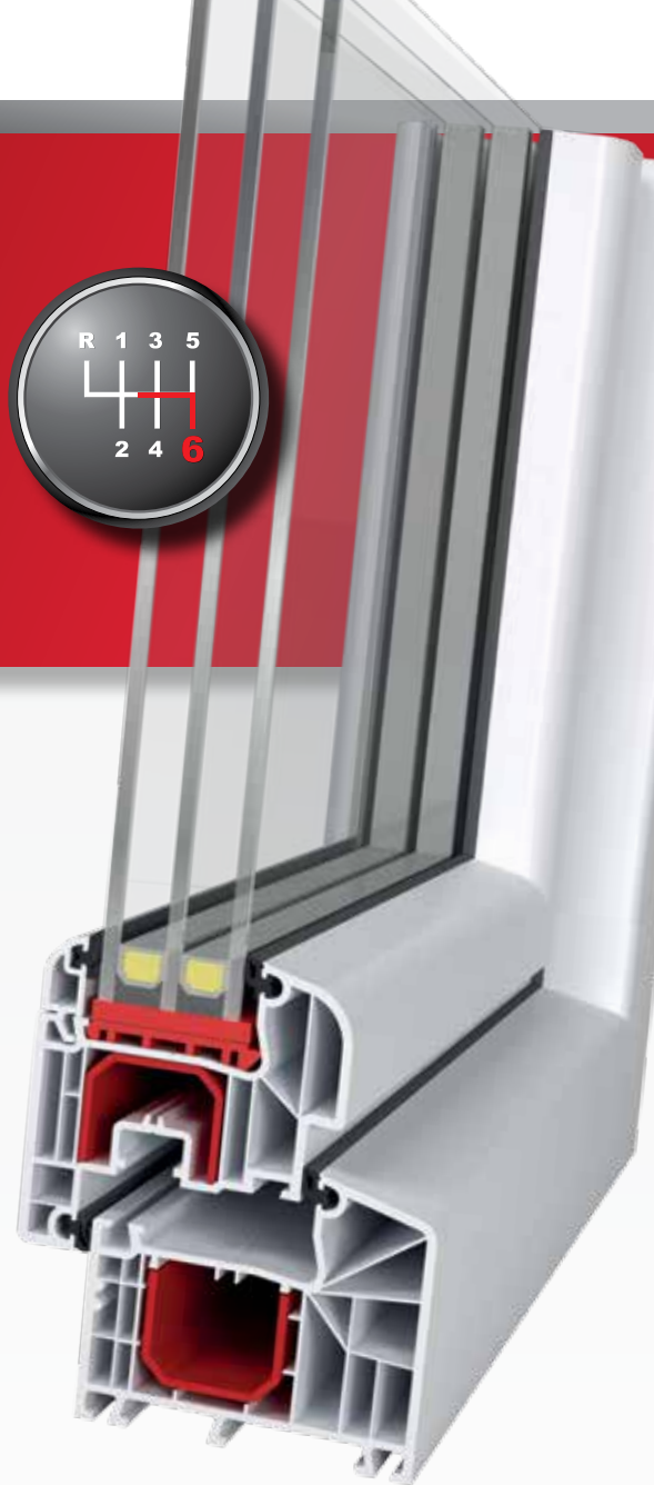
IDEAL 4000 PLUS Round-line | 85 mm

Gwarancja najwyższego standardu w oparciu o sprawdzony i doceniony przez Państwa produkt. IDEAL 4000 PLUS to rozwiązanie, przy projektowaniu którego szczególny nacisk położono na stylistykę oraz izolacyjność termiczną profilu. Idealne dopasowanie elementów i ich wzajemna kompatybilność pozwoliły połączyć w nowej serii niezwykle popularny wariant skrzydła z uszczelnieniem zewnętrznym wraz z sześciokomorową ramą o głębokości zabudowy 85 mm, co gwarantuje optymalne parametry izolacyjności cieplnej i akustycznej. Perfekcyjny dobór form sprawia jednocześnie, że okna w tej linii są doskonałym elementem w aranżacji wnętrz, które uzyskują oryginalny i nietuzinkowy wygląd.