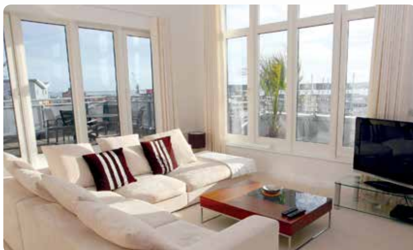
IDEAL 4000 PLUS Classic-line | 85 mm